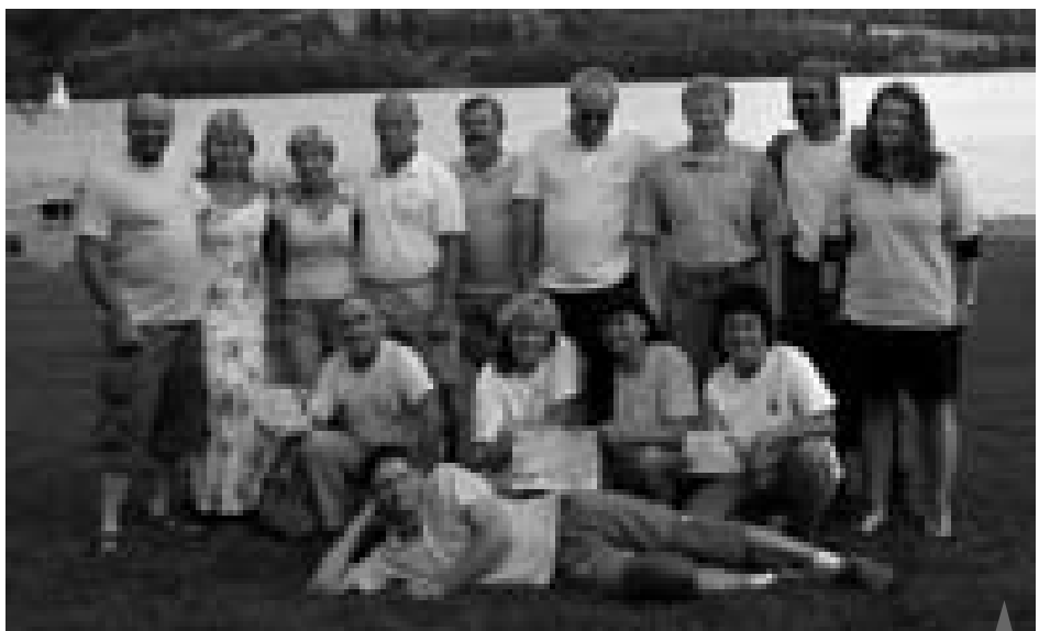
PROSTĚJOVSKÝM DÁLKOVÝM PLAVCŮM TJ HANÁ PATŘÍ V POŘADÍ DRUŽSTEV PRŮBĚŽNÉHO POŘADÍ ČESKÉHO POHÁRU ŠESTÉ MÍSTO.