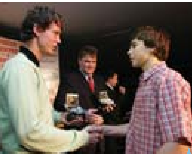
MLADÝM NADĚJÍM TK AGROFERT PROSTĚJOV SE DOSTALO GRATULACÍ PŘÍMO Z RUKOU HVĚZD SOUČASNÉHO SVĚTOVÉHO DĚNÍ, JAKO JE NAPŘÍKLAD TOMÁŠ BERDYCH.