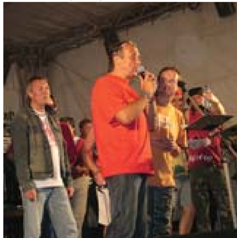
VDĚČNÝM FANOUŠKŮM, KTERÍ SE POD PÓDIEM SEŠLI AŽ V NEČEKANĚ HOJNÉM POČTU (SNÍMEK VPRAVO), PODĚKOVALI ORGANIZÁTORŮ KONCERTU I SAMI HUDEBNÍCI. SAMOTNOU ATMOSFÉRU SI NEJEN UŽÍVALI, ALE NESKRÝVALI, ŽE NĚCO TAKOVÉHO NEČEKALI ANI V TĚCH NEJOPTIMISTIČTĚJŠÍCH PŘEDSTAVÁCH.